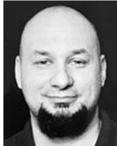
Wolfgang Kubitschek Funktion: Vizepräsident